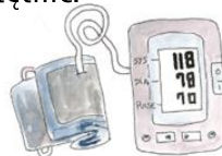
Pomiar ciśnienia tętniczego krwi

Serce przepompowuje krew przez wszystkie tętnice w organizmie. Jest to obieg zamknięty z ciągłym przepływem krwi, wywierającym w efekcie ciśnienie na ściany tętnic.